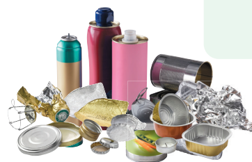
↑ Métaux y compris les petits éléments comme les capsules, les couvercles...