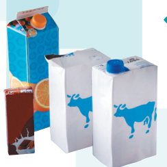
← Briques alimentaires