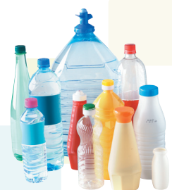
↑ Bouteilles et flacons en plastique

LA COLLECTE DES EMBALLAGES RECYCLABLES S'EFFECTUE EN SAC TRANSPARENT OU BAC JAUNE POUR LES HABITANTS DE LA COMMUNAUTÉ DE COMMUNES RIVES DE MOSELLE. VOUS POUVEZ DÉPOSER DANS LE SAC TRANSPARENT (OU BAC JAUNE POUR L'HABITAT COLLECTIF) TOUS LES EMBALLAGES MÉNAGERS SANS DISTINCTION : LES EMBALLAGES EN MÉTAL, LES BRIQUES ALIMENTAIRES, LES CARTONNETTES ET TOUS LES EMBALLAGES EN PLASTIQUE, SANS EXCEPTION. UNE SIMPLIFICATION MAJEURE DU GESTE DE TRI !