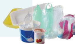
↑ Emballages en plastique (pots de yaourts, barquettes, films plastiques etc...)